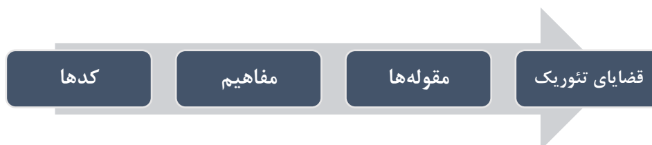
شکل (۳-۳) سیر تطوّر کدها تا تئوری در نظریه داده بنیاد

لازم به ذکر است، معیار قضاوت در مورد زمان متوقف کردن فرآیند جمع آوری داده‌ها، «کفایت نظری» مقوله‌ها یا نظریه است. کفایت نظری مرحله است که جمع آوری هرگونه داده کمکی به افزایش ویژگی‌ها و غنای یک مقوله نکند. به عبارت دیگر هیچ داده بیشتری یافت نمی‌شود که پژوهشگر به وسیله آن بتواند مقوله را رشد دهد. به موازاتی که پژوهشگر داده‌های مشابه را به دفعات مشاهده می‌کند، از لحاظ تجربی اطمینان حاصل می‌کند که یک مقوله به کفایت رسیده است... بنابراین در روش داده بنیاد، نمونه گیری توسط ظهور مفاهیم نو - و نه طرح پژوهش به پیش می‌رود و توسط کفایت نظری - و نه طرح پژوهش - محدود می‌شود (پرایس ۱ ، ۲۰۱۰).