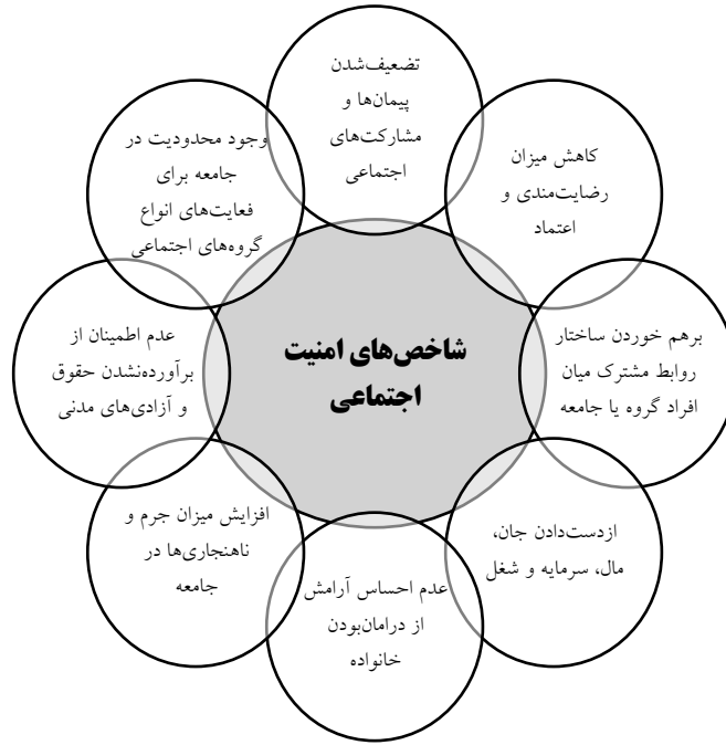
نمودار ۱. شاخص‌های امنیت اجتماعی